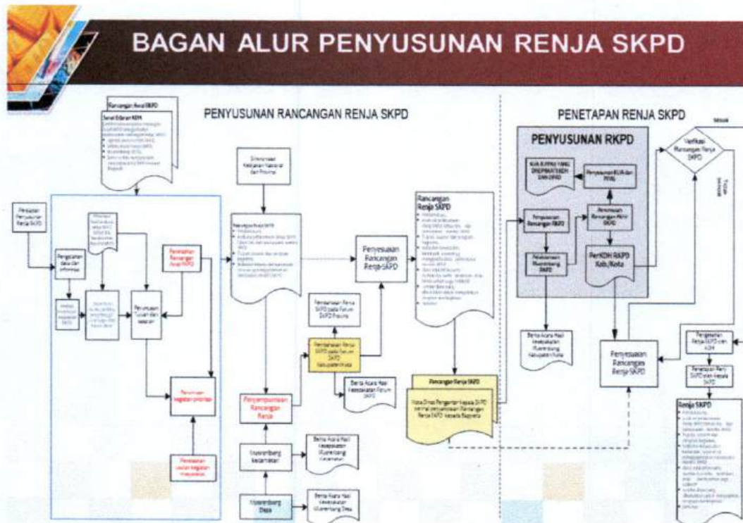
Gambar 1.1 Bagan Alur Penyusunan Renja SKPD

Adapun bagan alur tahapan penyusunan rencana kerja perangkat daerah adalah sebagaimana tercantum dalam gambar dibawah ini,